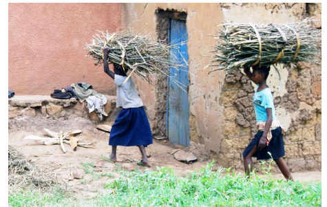
Die Grenzen zwischen dem Nationalpark und den umliegenden Siedlungsgebieten werden täglich auf der Suche nach brennbarem Holz überschritten.